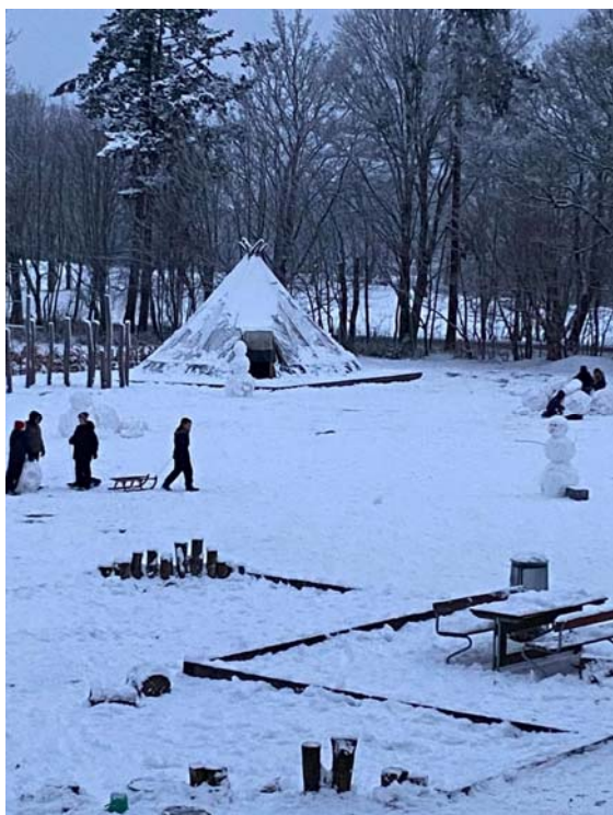
Der er godt med sne på sportspladsen; og der anes lige en snemand til højre.

Godt nytår! skal lyde fra Tybjerg Privatskole med håbet om, at I alle er kommet godt ind i det nye år. Og vinter er det blevet i år og endda på fuld piv. Det mærker vi bestemt også på skolen, men hvorom alting er, så bringer det hvide dække mest lykke hos børnene. Den hårde frost gør dog, at snemændene lader vente på sig, men der bliver kuret og kælket til den helt store guldmedalje, og vi skal hilse at sige fra de lidt større drenge, at fodbold sagtens kan lade sig gøre i snevejr! Hvor der er vilje, er der en vej, samt en neonfarvet bold.