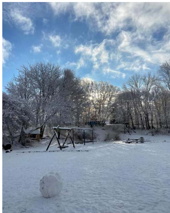
Enten er snemanden her opgivet, eller også er det en kæmpesnebold, der ligger i forgrunden

Januar føles jo altid lidt stille efter en julemåned fyldt med aktiviteter. Skolens støtteforening afholder derfor diskofest for de yngste klasser med alt, hvad der hører til af høj musik og blinkende lygter. Det er blevet en tilbagevendende begivenhed, som altid er rigtig sjov og hyggelig i det vacuum, der opstår for børnene efter julen. Det er en fest, som opstod som pendant til de hyggeaftener, som Frit'n holder for den ældre halvdel af eleverne. En sådan hyggeaften er der såmænd også på tapetet: den populære wellness-/gamer-aften. Det kan man også trænge til i dette vintervejr.